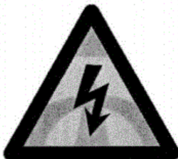
图 1 高压警告标记

当人员接近 REESS 的高压部分时,应能看见该警告标记。还应清晰可见地注明 REESS 的种类(例如,超级电容器、铅酸电池、镍氢电池、锂离子电池等),以便识别。